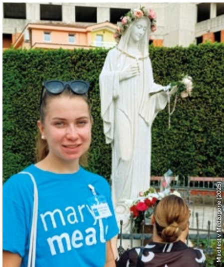
Mladicek v Mchadzogorje (2025)

Studuji učitelský obor, takže nemám problém mluvit před třídou. Ale při této přednášce jsem se necítila úplně komfortně. Pro některé studenty je tohle téma úplně bezvýznamné a je dost náročné jejich názory změnit. Jiné ale věc zaujala a třeba se v budoucnu stanou součástí školního týmu Mary's Meals. ☺ ]