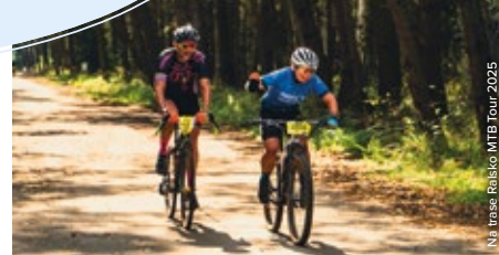
Na trase Raksko MTB Tour 2025

Jako ambasadorka se snažím představovat dílo Mary's Meals mezi mladými. Například už zmíněnými přednáškami anebo na různých akcích. Vedu také tým, který má propagaci Mary's Meals na naší škole dlouhodobě na starost. Brzy budu maturovat a půjdu na vysokou. Proto se v posledních měsících snažím náš školní dobrovolnický tým ještě víc rozvinout, najít co nejvíce nových tváří a předat štafetu. ]