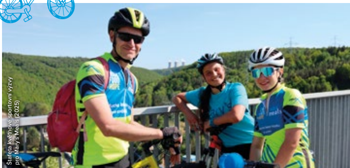
Stáleja květinové sportovní výzvy pro Mary's Meals (2025)